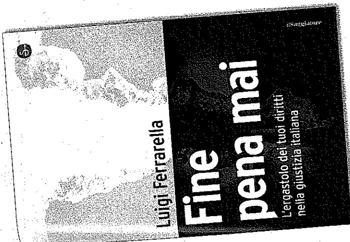
"Fine pena mai" di Luigi Ferrarella (Il Saggiatore)