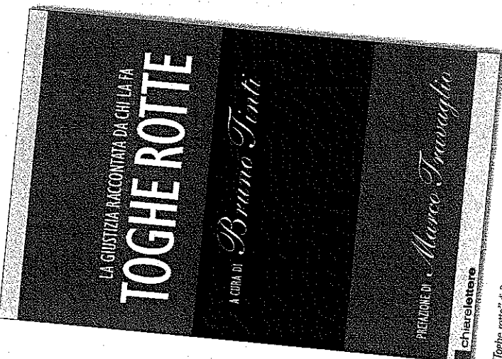
"Toghe rotte" di Bruno Tinti (Chiara Lettore)